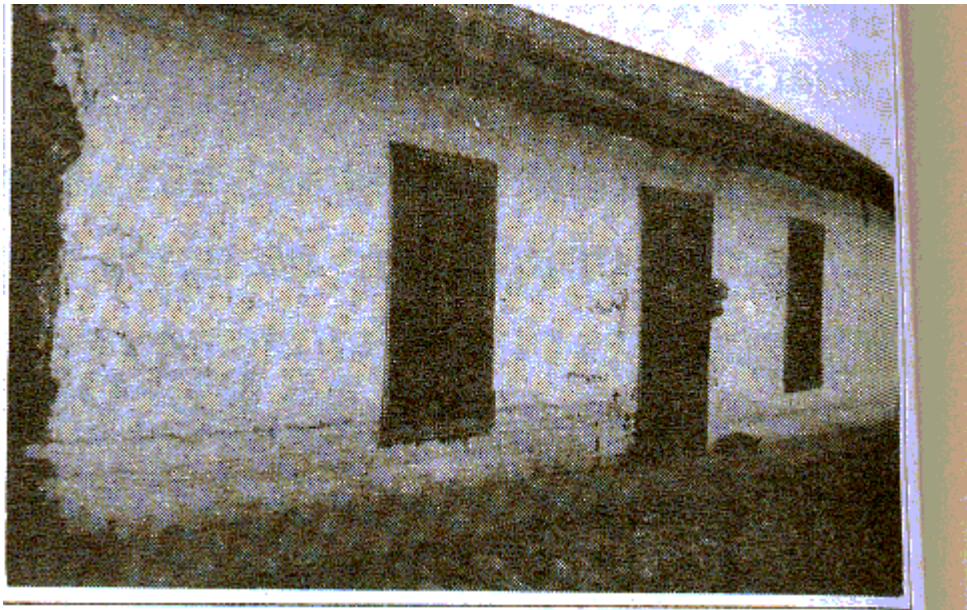
Segunda Municipalidad Lo Valdivia