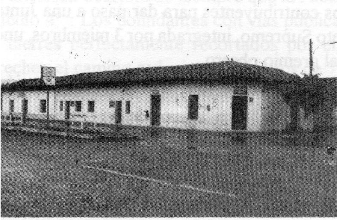
Primer edificio de la municipalidad en Sagrada Familia